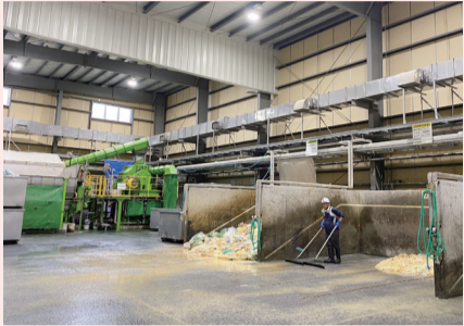
食品廃棄物とそのほかを分別する前処理棟の内部